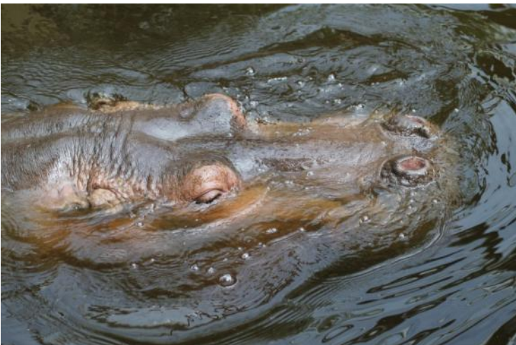
Hippopotamus amphibius - Flusspferd oder Krokodil?

Erdmännchen üben eine hohe Anziehungskraft aus - auf jung und alt